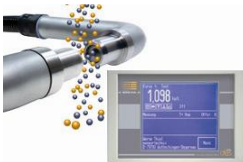
OLAS Messprinzip und OLAS-TPC (Touch Panel Control)

Die frühere Firma „Arnold Automation“ – bekannt als Pionier von Feuchtemesssystemen in der Betonproduktion – wurde im Jahr 2002 von der „Werne & Thiel sensortechnic“ übernommen. Neben der kontinuierlichen Weiterentwicklung der bewährten Arnold-Feuchtemesssonden haben sich die neuen Inhaber auf die Entwicklung innovativer, industrieller Sensortechnik spezialisiert.