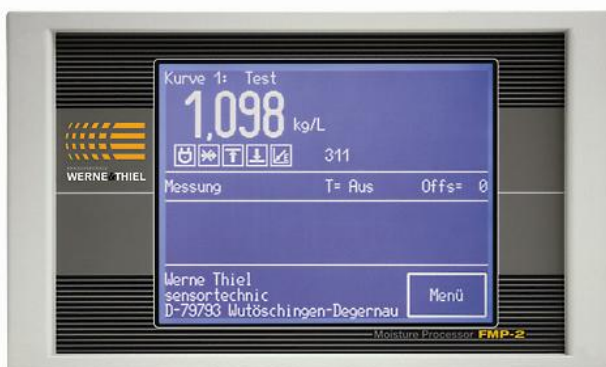
OLAS-TPC: Auswerteeinheit mit Anzeige im Betrieb

Um auch bei Anwendungen in deutlich durchsichtigeren Messmedien Beeinflussungen der Messgenauigkeit durch Verkratzungen ausschliessen zu können, sind für den OLAS auf Wunsch auch „vorgealterte“ Optiken erhältlich.