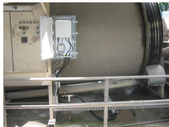
Messelektronik im Schutzgehäuse

Weitere Stimmen von Anwendern bescheinigen, dass es sich bei dem OLAS-Messsystem um ein durchdachtes, innovatives und flexibles Messsystem handelt, das entscheidend dazu beitragen kann, bei Verwendung von Betonrecyclingwasser in der Betonproduktion eine hohe Betonqualität sicherzustellen.