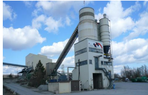
Betonanlage der HOLCIM Kies- und Beton AG in Dissenhofen/CH

Die Transportbetonindustrie bemüht sich schon seit vielen Jahren um einen Übergang von einer reinen Entsorgungstechnik zu einer Materialwirtschaft in geschlossenen Stoffkreisläufen. Doch dies erfordert neue Messsysteme und neue Technologien. Die Firma „Werne & Thiel sensortechnic“ hat sich dieser Herausforderung angenommen und mit dem „OLAS-Messsystem“ ein revolutionäres Online-Messverfahren zur Bestimmung der Dichte von Betonrecyclingwasser entwickelt.