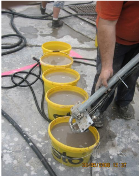
Eichung des OLAS mittels der angefertigten Proben

OLAS-TPC errechnet dabei aus den Eichpunkten vollautomatisch die Eichkurve durch lineare Interpolation. Auf diese Weise kann die vollständige Eichkurve mit allen Eichpunkten innerhalb von Minuten eingegeben werden! Nach dieser Eichung ist das OLAS-Messsystem betriebsbereit und zeigt die korrekte Dichte in kg/l an. Das auf diese Weise linearisierte Messsignal kann nun direkt an eine Prozesssteuerung weitergeleitet werden.