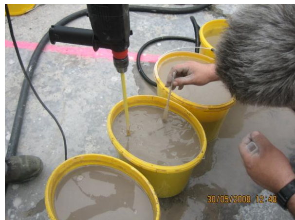
Ermittlung der Dichte von Proben mittels Aärometer

Die Eichung des Messsystems gestaltet sich sehr einfach. Es werden zunächst mehrere verschiedene Proben im Dichtebereich von beispielsweise 1,000 bis 1,150 kg/l vorbereitet, wobei die Probe zum Nullabgleich aus klarem Wasser bestehen sollte. Die halb-automatische Eichprozedur des OLAS-TPC gestattet nun auf einfachste Weise die direkte Eingabe der Eichpunkte. Dazu wird der Messkopf in die erste Probe getaucht, der Messwert automatisch abgespeichert und unmittelbar danach der mit einem Aärometer ermittelte Referenz-Dichtewerte eingegeben. Dieser Vorgang wird mit den anderen Proben wiederholt. Der