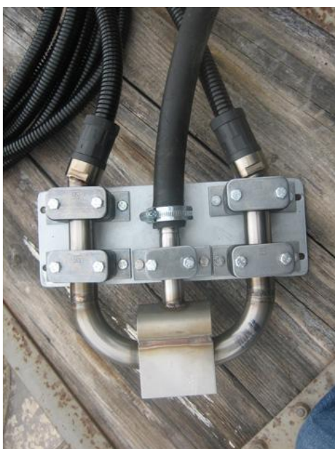
Messkopf mit Glasfaser Schutzleitung und „Nulltest“-Kontrolleinheit

Maximalintensität zuverlässig erfassen und anzeigen. Die interne Auflösung des OLAS-Messsystems ist sogar noch höher. Gerade bei hochdichten Medien wie Betonrecyclingwasser ist die Durchdringung des Messlichts enorm und das OLAS-Messsystem kann seine Stärken ausspielen.