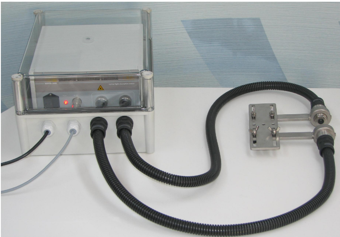
Bild 2: OLAS in „voller Montur“, mit Übergehäuse, Schutzrohren und Optik